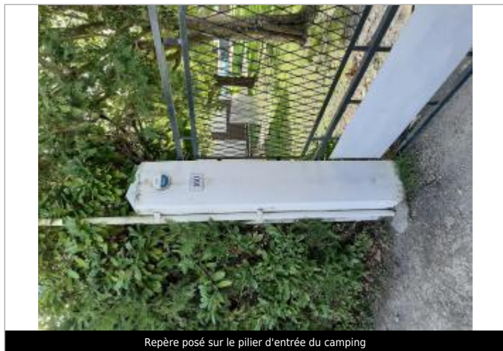
Repère posé sur le pilier d'entrée du camping