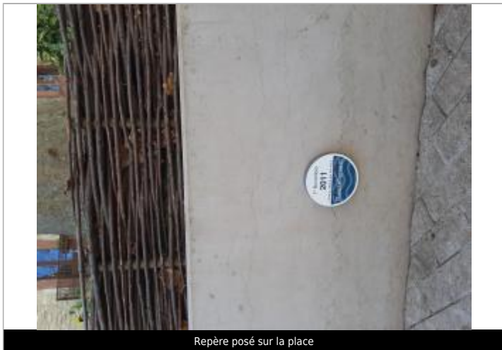
Repère posé sur la place

Texte : 1er novembre 2011 Maximum de l'inondation : Oui Visibilité : Oui État du repère : Bon Pérennité : Longue