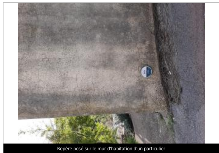
Repère posé sur le mur d'habitation d'un particulier