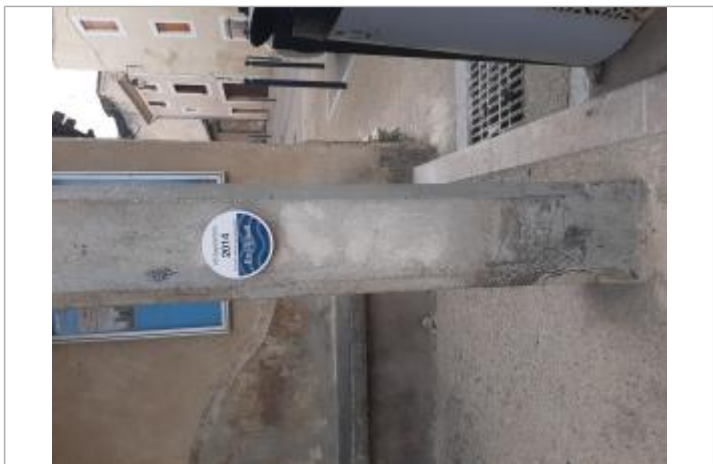
Repère posé sur le pilier

Texte : 2014 Maximum de l'inondation : Oui Visibilité : Oui État du repère : Bon Pérennité : Longue