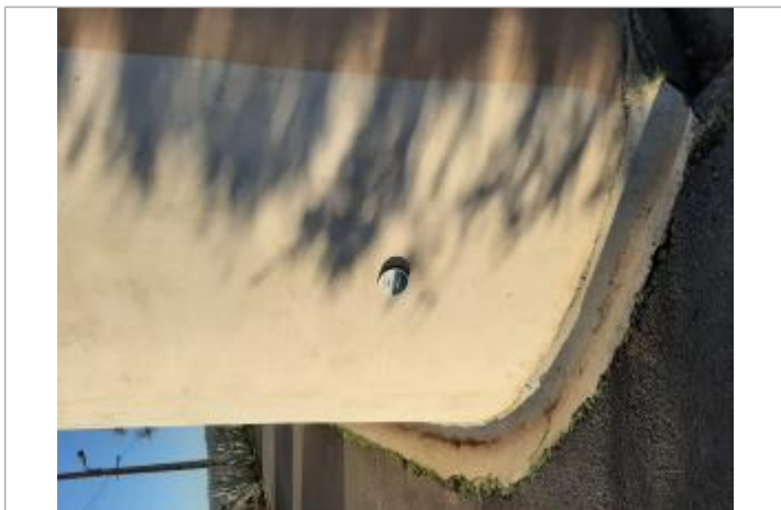
Repère posé sur le mur côté rue d'un particulier

Texte : 1997 Maximum de l'inondation : Oui Visibilité : Oui État du repère : Bon Pérennité : Longue