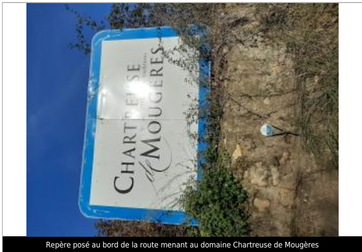
Repère posé au bord de la route menant au domaine Chartreuse de Mougères