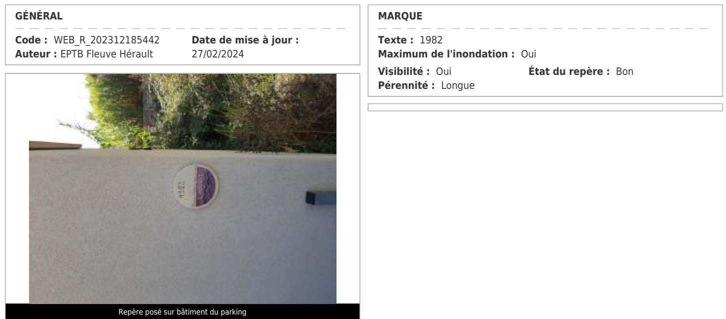
Repère posé sur bâtiment du parking