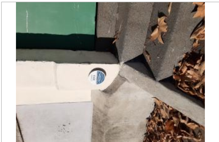
Repère posé à l'entrée de l'école