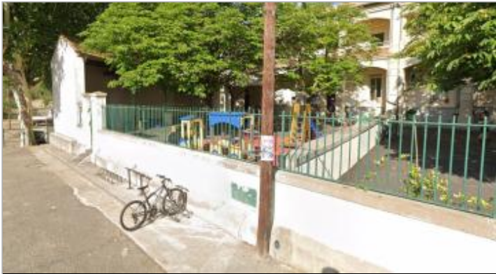
repère au niveau du portail de l'école

GÉOLOCALISATION Coordonnées WGS84 : X: 3.28112172 / Y: 43.48325830 Coordonnées RGF93 (Lambert 93) X: 722752.1 / Y: 6264948.07 Coordonnées RGF93 (ETRS89) : X: 3.2811217 / Y: 43.4832583 Code Hydro: Y2360500 Rive de référence: