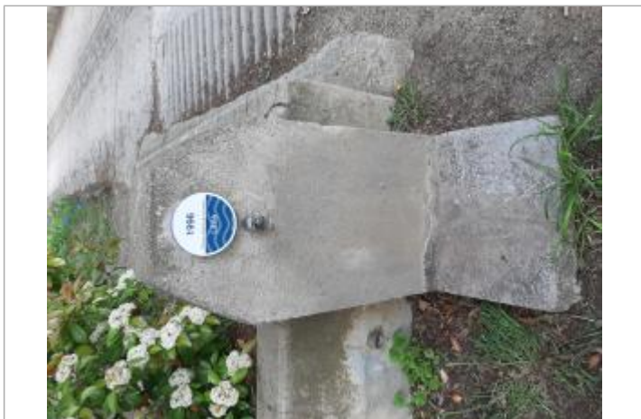
Repère posé sur la fontaine