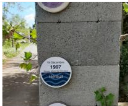
macaron 1997 florensac c jardins

Système altimétrique : NGF IGN 1969 (système normal)