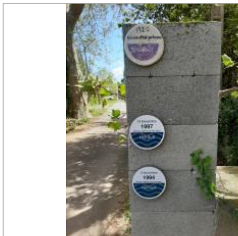
reperes sur pilier chemin jardins florensac

Coordonnées WGS84 : X: 3.46135038 / Y: 43.37920710