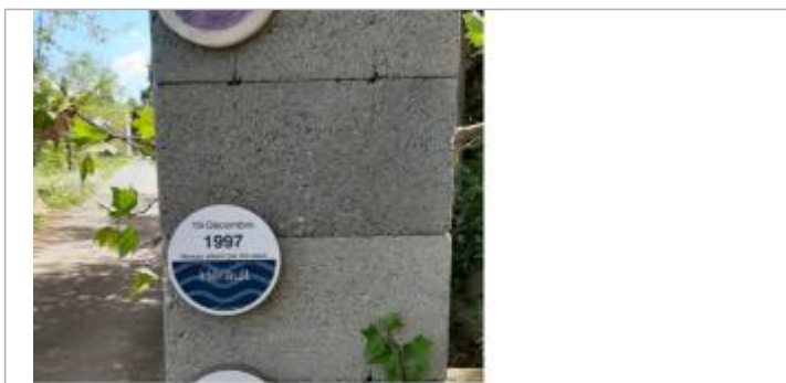
macaron 1997 florensac c jardins

• Système altimétrique : NGF IGN 1969 (système normal) Altitude de la référence (en m) : 8.900 m Altitude calculée de l'eau (en m) : 8.9