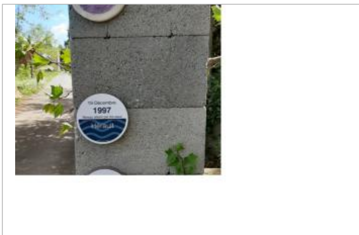
macaron 1997 florensac c jardins

• Système altimétrique : NGF IGN 1969 (système normal) Altitude de la référence (en m) : 8.900 m Altitude calculée de l'eau (en m) : 8.9