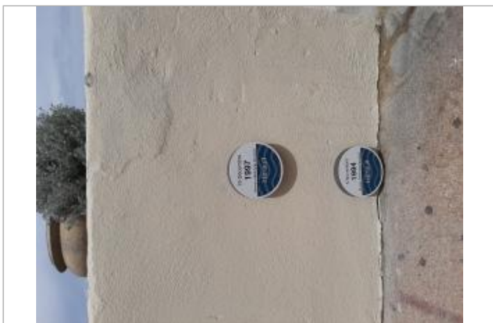
Repère posé sur un terre plein