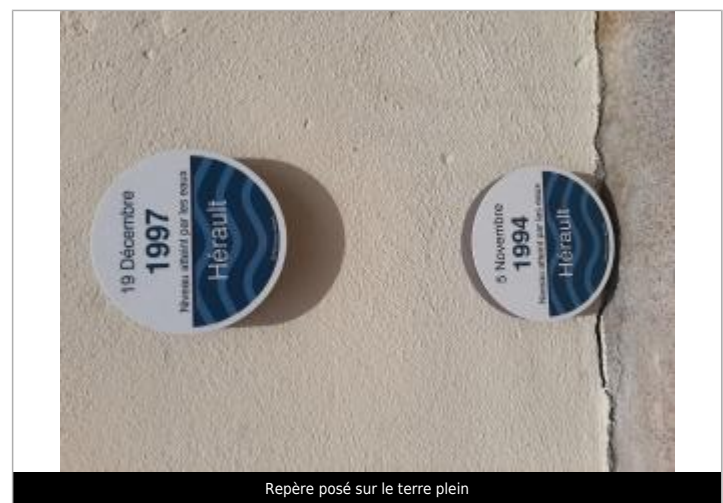
Repère posé sur le terre plein