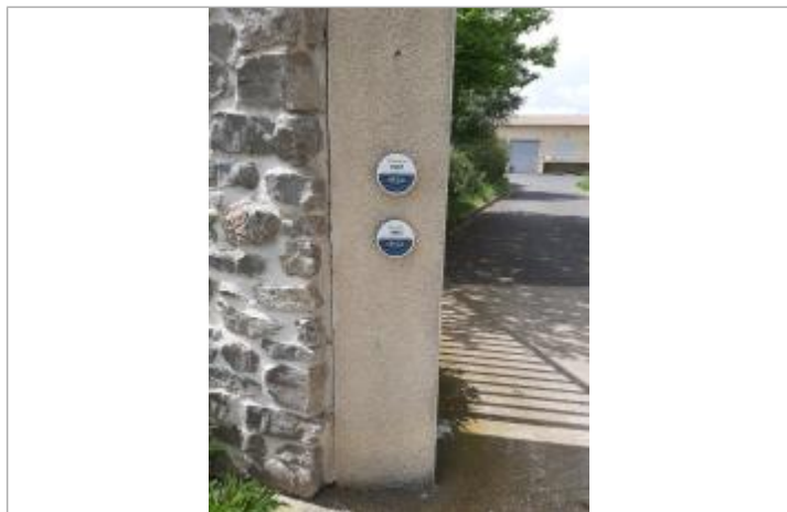
Repère posé sur le pilier d'entrée de la STEP

Altitude calculée de l'eau (en m) : 6.79 m