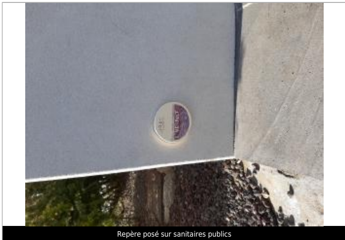
Repère posé sur sanitaires publics