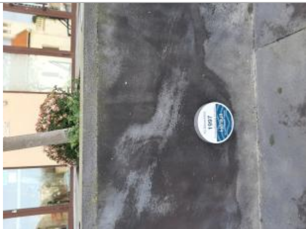
Repère posé devant la mairie