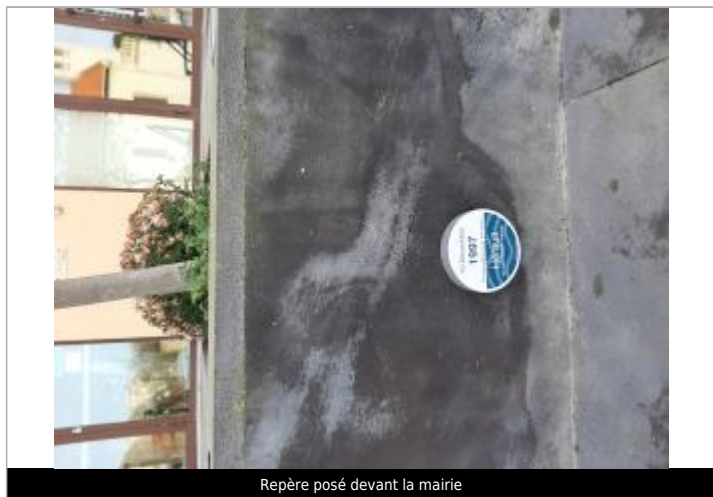
Repère posé devant la mairie