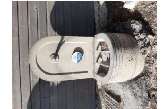
Repère posé sur une fontaine communale

MARQUE Maximum de l'inondation : Oui Visibilité : Oui État du repère : Bon Pérennité : Longue