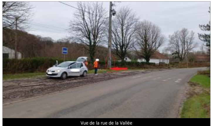
Vue de la rue de la Vallée

Coordonnées WGS84 : X: 1.79174072 / Y: 50.54520360