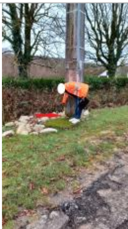
laisse de crue à 6 cm/sol