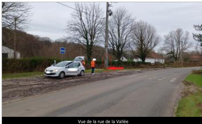
Vue de la rue de la Vallée