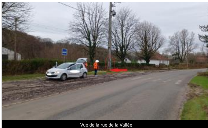
Vue de la rue de la Vallée