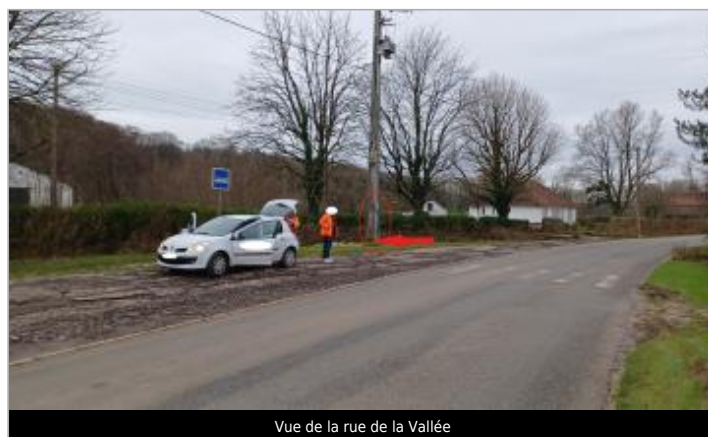
Vue de la rue de la Vallée

GÉOLOCALISATION Coordonnées WGS84 : X: 1.79174072 / Y: 50.54520360 Coordonnées RGF93 (Lambert 93) X: 614224.58 / Y: 7050432.33 Coordonnées RGF93 (ETRS89) : X: 1.7917407 / Y: 50.5452036 Code Hydro: E5410640 Rive de référence: Droite