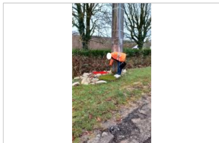
laisse de crue à 6 cm/sol

GÉNÉRAL Code : WEB_R_202312180055 Date de mise à jour : 18/12/2023 Auteur : SACN_FD