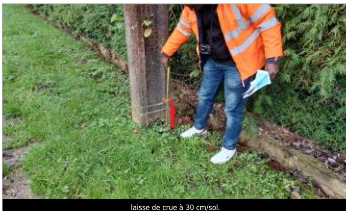
laisse de crue à 30 cm/sol.