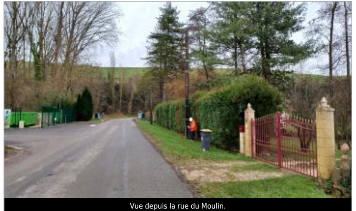
Vue depuis la rue du Moulin.

Coordonnées WGS84 : X: 1.78950121 / Y: 50.52103290