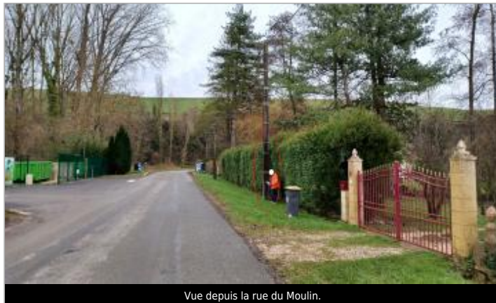
Vue depuis la rue du Moulin.