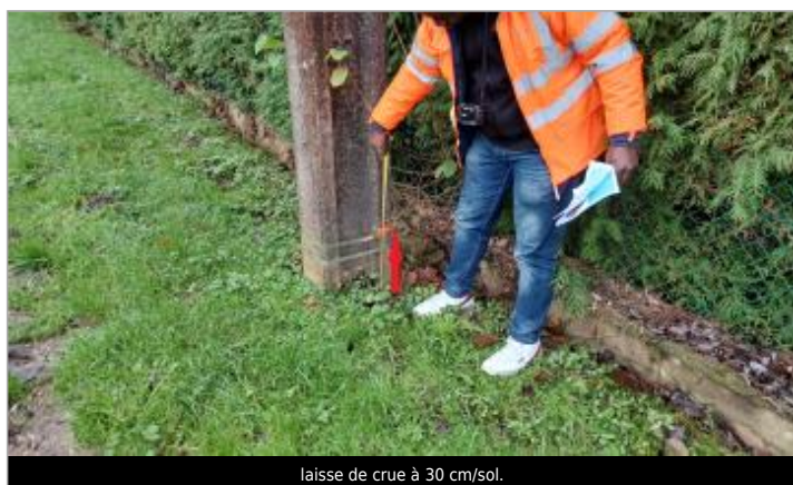
laisse de crue à 30 cm/sol.