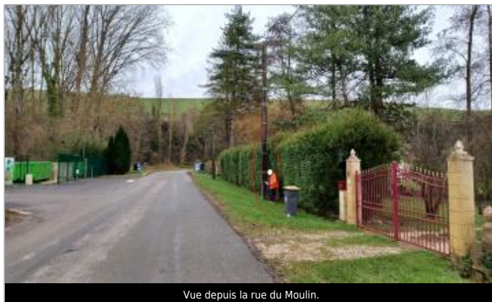
Vue depuis la rue du Moulin.