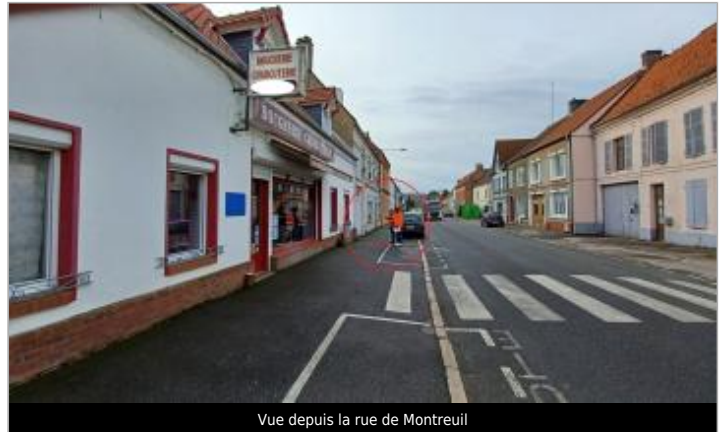
Vue depuis la rue de Montreuil

Coordonnées WGS84 : X: 1.77515569 / Y: 50.47345870