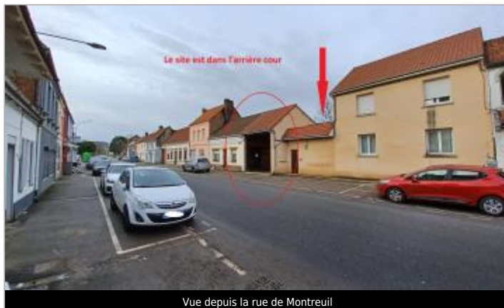
Vue depuis la rue de Montreuil