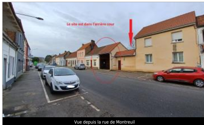
Vue depuis la rue de Montreuil

GÉOLOCALISATION Coordonnées WGS84 : X: 1.77393476 / Y: 50.47293250 Coordonnées RGF93 (Lambert 93) X: 612835.6 / Y: 7042401.1 Coordonnées RGF93 (ETRS89) : X: 1.7739348 / Y: 50.4729325 Code Hydro: E5410640 Rive de référence: Gauche