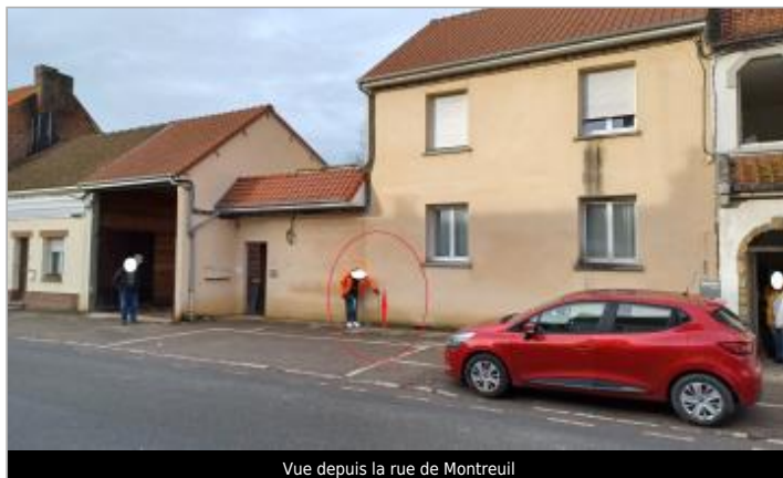
Vue depuis la rue de Montreuil

Coordonnées WGS84 : X: 1.77423015 / Y: 50.47292540