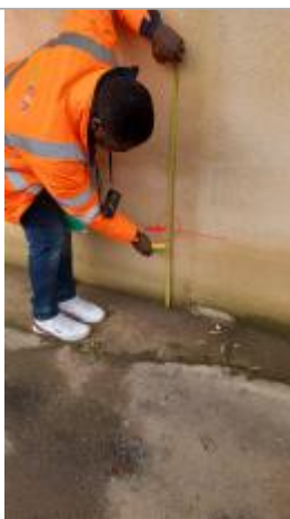
Laisse de crue à 22 cm/sol.

Altitude calculée de l'eau (en m) : 6.59 m