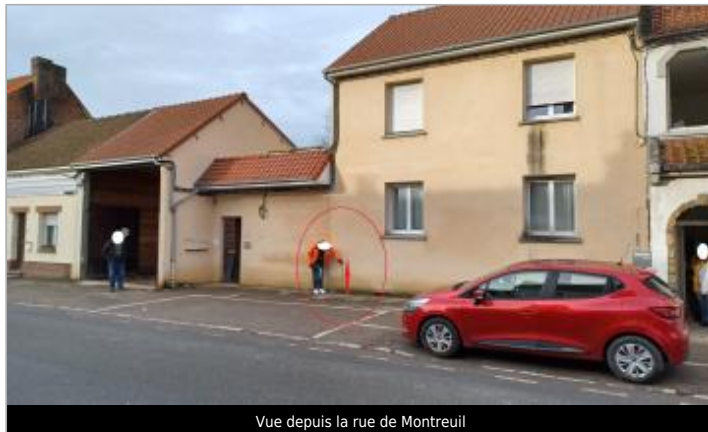
Vue depuis la rue de Montreuil