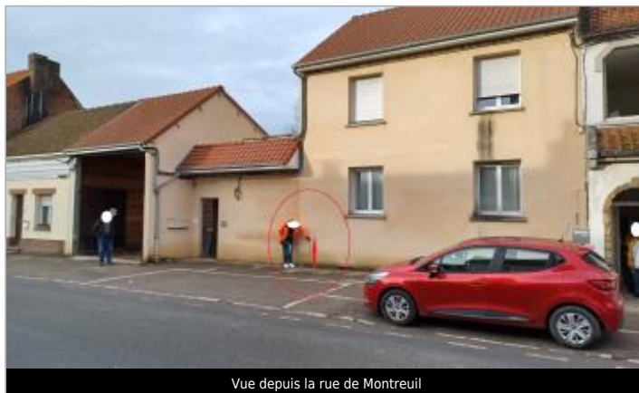
Vue depuis la rue de Montreuil