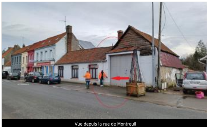
Vue depuis la rue de Montreuil