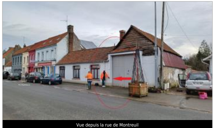
Vue depuis la rue de Montreuil

Coordonnées WGS84 : X: 1.77393769 / Y: 50.47251140