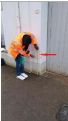
Laisse de crue à 71.5 cm/sol.

Altitude calculée de l'eau (en m) : 6.955