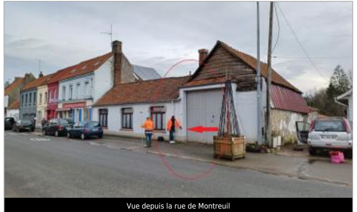
Vue depuis la rue de Montreuil

Coordonnées WGS84 : X: 1.77393769 / Y: 50.47251140