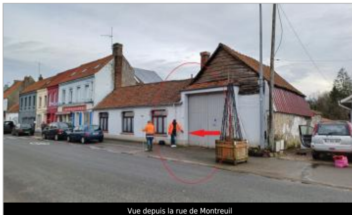
Vue depuis la rue de Montreuil