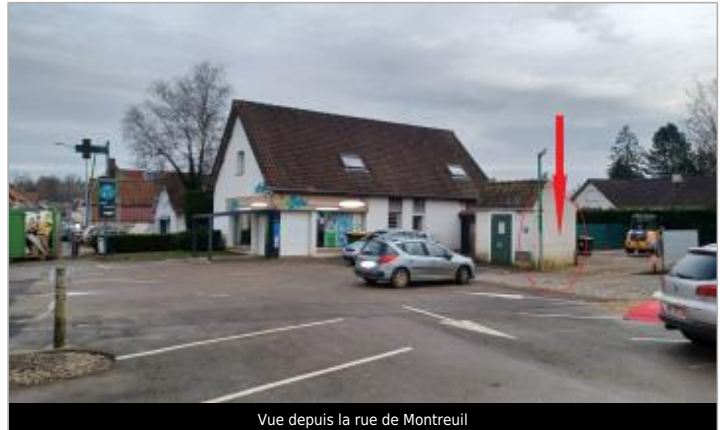
Vue depuis la rue de Montreuil

Coordonnées WGS84 : X: 1.77380156 / Y: 50.47212140