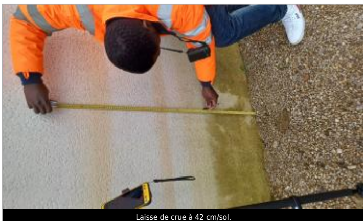
Laisse de crue à 42 cm/sol.