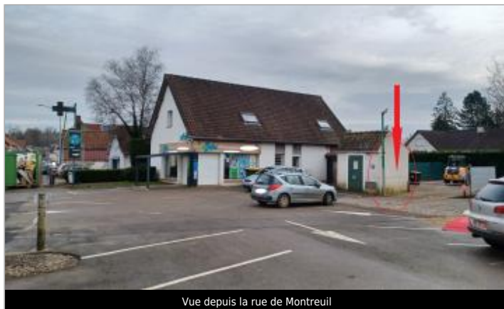
Vue depuis la rue de Montreuil