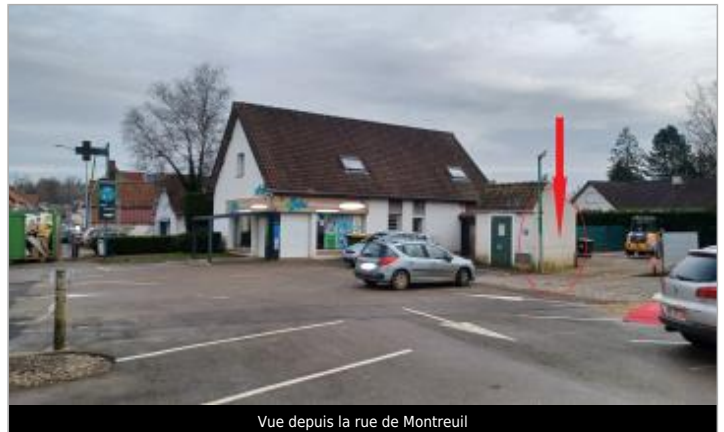
Vue depuis la rue de Montreuil

Coordonnées WGS84 : X: 1.77380156 / Y: 50.47212140