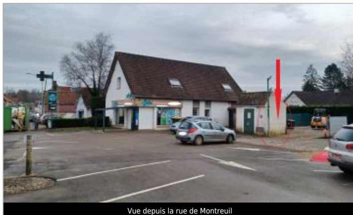
Vue depuis la rue de Montreuil

Coordonnées WGS84 : X: 1.77380156 / Y: 50.47212140