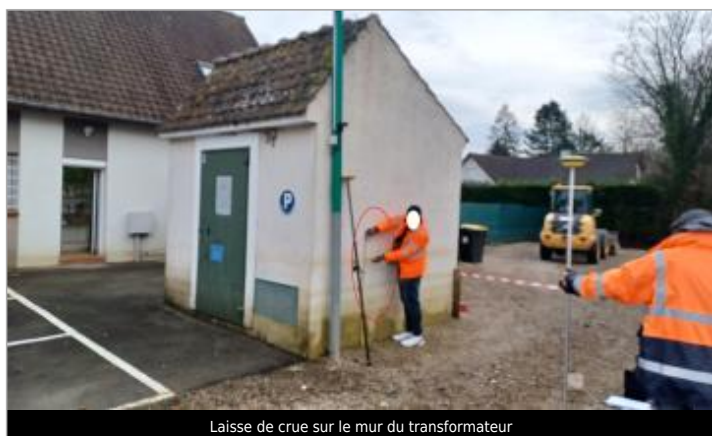
Laisse de crue sur le mur du transformateur