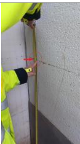
Laisse de crue à 117 cm/margelle de la porte.

Organisme : SPC Seine aval - Côtiers normands