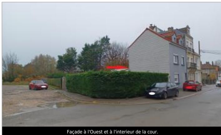
Façade à l'Ouest et à l'intérieur de la cour.

Coordonnées WGS84 : X: 1.62724726 / Y: 50.68307810