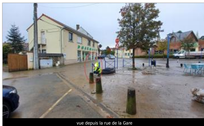
vue depuis la rue de la Gare

GÉOLOCALISATION Coordonnées WGS84 : X: 1.62696363 / Y: 50.68194780 Coordonnées RGF93 (Lambert 93) X: 602792.94 / Y: 7065858.14 Coordonnées RGF93 (ETRS89) : X: 1.6269636 / Y: 50.6819478 Code Hydro: E53-0020 Rive de référence: Gauche