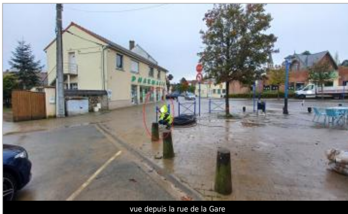
vue depuis la rue de la Gare

GÉOLOCALISATION Coordonnées WGS84 : X: 1.62696363 / Y: 50.68194780 Coordonnées RGF93 (Lambert 93) X: 602792.94 / Y: 7065858.14 Coordonnées RGF93 (ETRS89) : X: 1.6269636 / Y: 50.6819478 Code Hydro: E53-0020 Rive de référence: Gauche