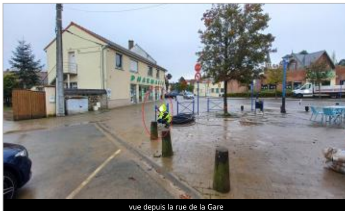
vue depuis la rue de la Gare