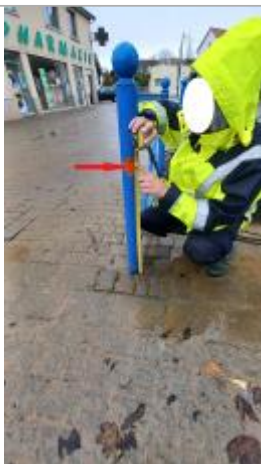
Laisse de crue à 69 cm/sol

Organisme(s) : SPC Seine aval - Côtiers normands