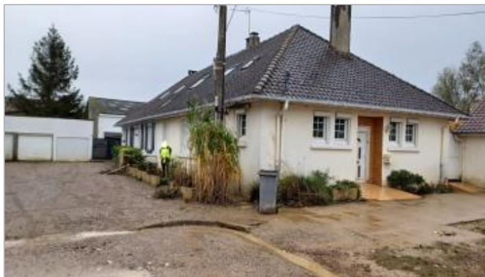
Vue depuis le 7 bis cité de l'Avenir