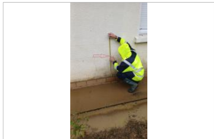
Laisse de crue à 58 cm/sol.