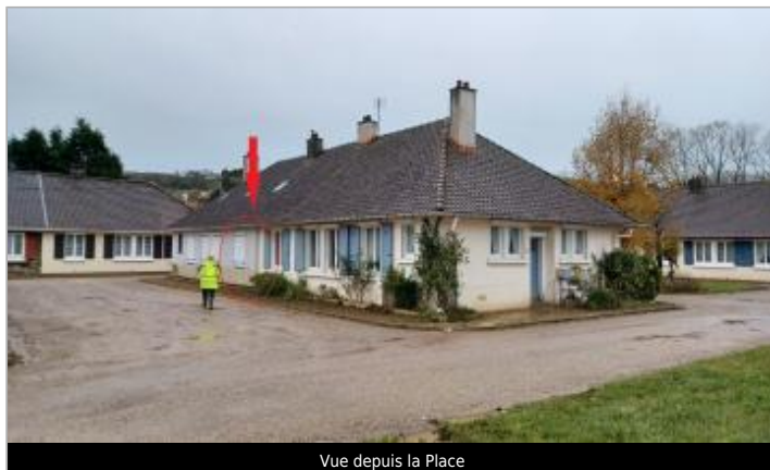
Vue depuis la Place

Coordonnées WGS84 : X: 1.62570643 / Y: 50.68421780