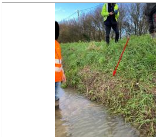
Laisse sur berge