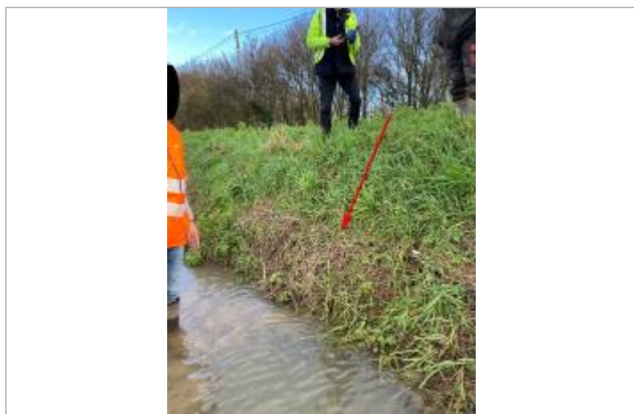
Laisse sur berge