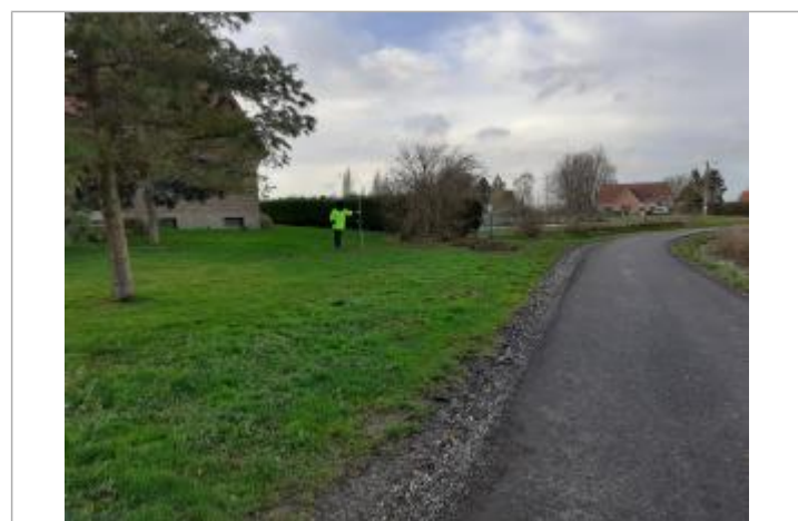
106 rue des Pacavas

GÉNÉRAL Code : WEB_R_202312045830 Date de mise à jour : 04/12/2023 Auteur : SPC BN