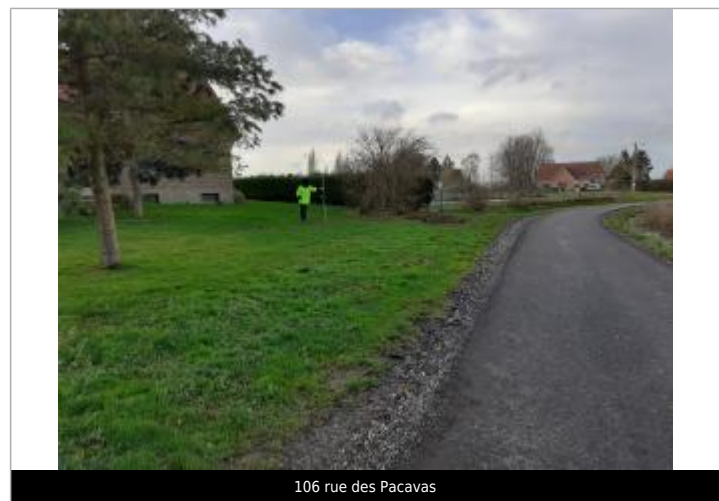
106 rue des Pacavas