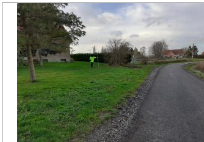
106 rue des Pacavas