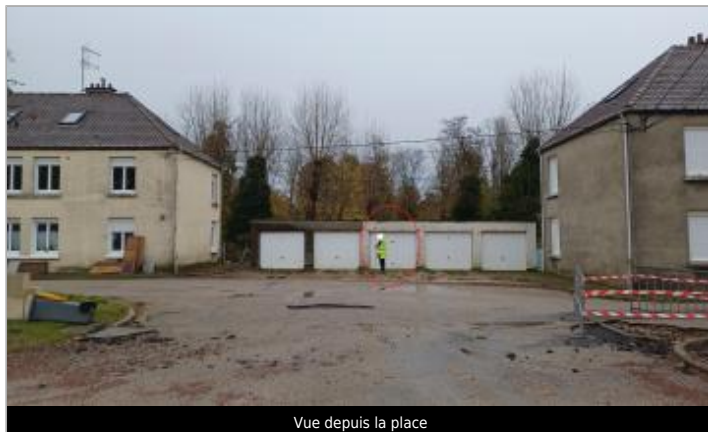
Vue depuis la place

Coordonnées WGS84 : X: 1.62615316 / Y: 50.68455600