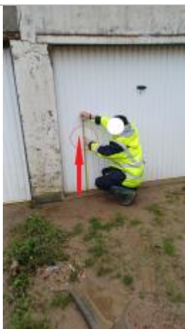
Laisse de crue à 82 cm/sol

Altitude calculée de l'eau (en m) : 7.42