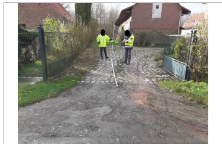
71 haute rue

GÉNÉRAL Code : WEB_R_202312041704 Date de mise à jour : 04/12/2023 Auteur : SPC BN