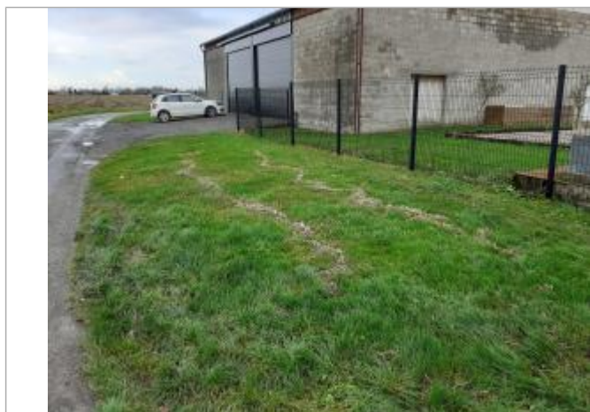
Face au 1121 rue de l'Alger

Altitude calculée de l'eau (en m) : 17.75 m