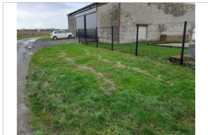
Face au 1221 rue de l'Alger

GÉNÉRAL Code : WEB_R_202312045634 Date de mise à jour : 04/12/2023 Auteur : SPC BN