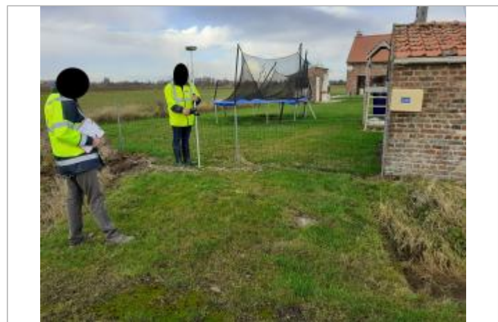
Face au 510 rue de l'Alger

GÉNÉRAL Code : WEB_R_202312043208 Date de mise à jour : 04/12/2023 Auteur : SPC BN