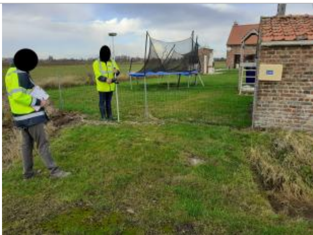
Face au 510 rue de l'Alger

Altitude calculée de l'eau (en m) : 17.7