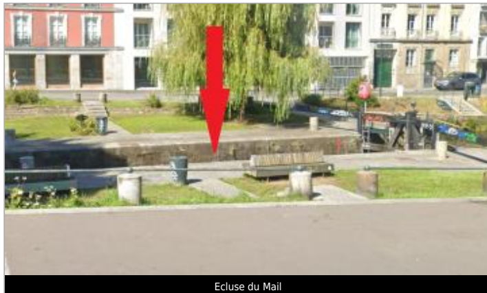
Ecluse du Mail