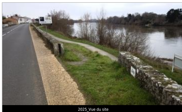
2025_Vue du site

GÉOLOCALISATION Coordonnées WGS84 : X: -1.38785188 / Y: 47.28068900 Coordonnées RGF93 (Lambert 93) X: 368485.68 / Y: 6695921.61 Coordonnées RGF93 (ETRS89) : X: -1.3878519 / Y: 47.280689 Code Hydro: ----0000 Rive de référence: Gauche