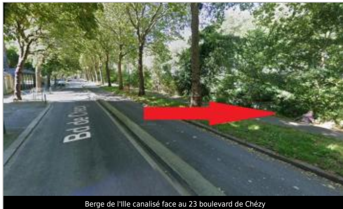
Berge de l'Ille canalisé face au 23 boulevard de Chézy