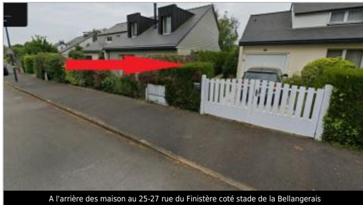
A l'arrière des maison au 25-27 rue du Finistère coté stade de la Bellangerais

Coordonnées WGS84 : X: -1.67695011 / Y: 48.13426700